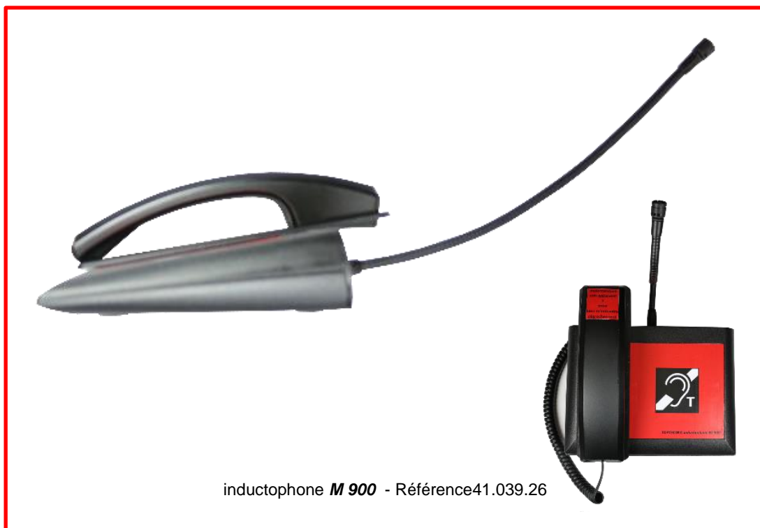
inductophone M 900 - Référence 41.039.26

Ensemble compact et robuste, M 900 concentre dans un boîtier ergonomique l'expérience Toptronic des inductophones d'accueil C 900 , sans concession : micro agent directionnel, circuit rayonnant planar, portée 90 cm et combiné « non T ».