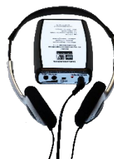
41.014.11 - inductomètre contrôle de boucle