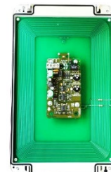
41.039.14 circuit rayonnant