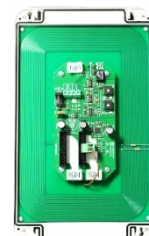
41.049.14 circuit rayonnant