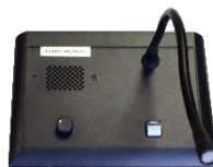
Pupitre superviseur 41.054.96L