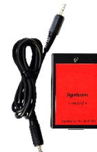
Enregistrement retransmission 10.002.13